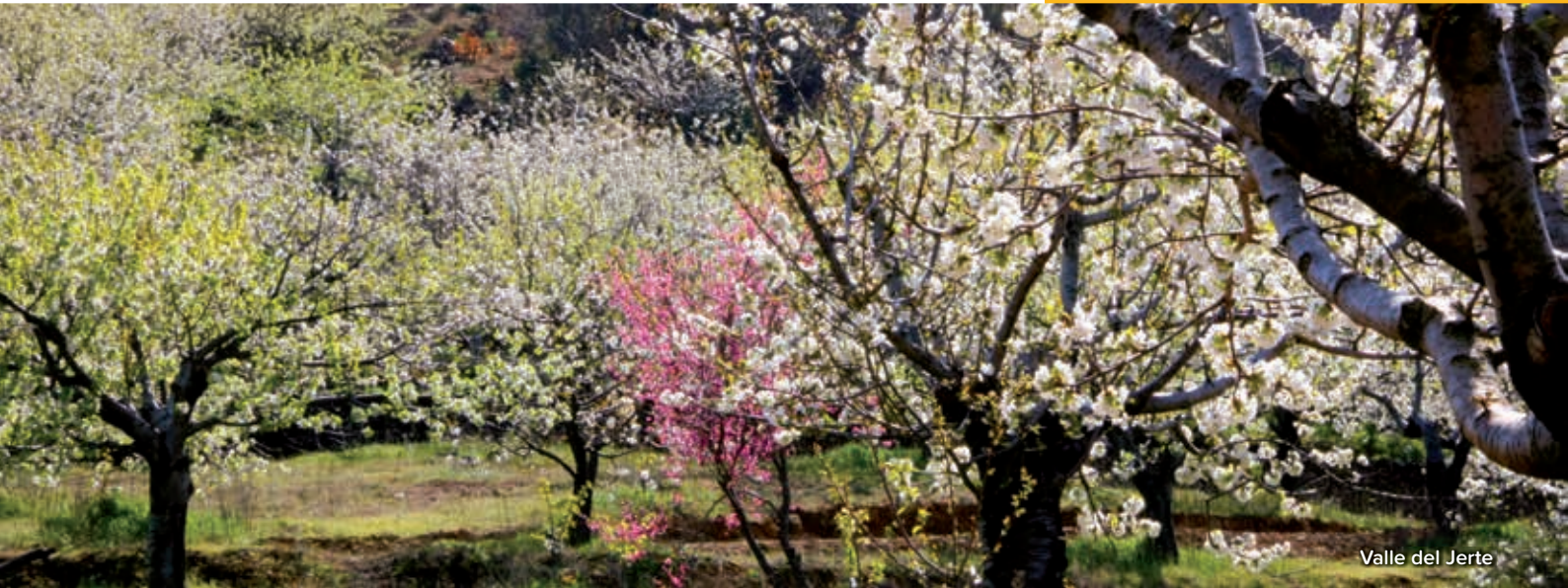
Valle del Jerte